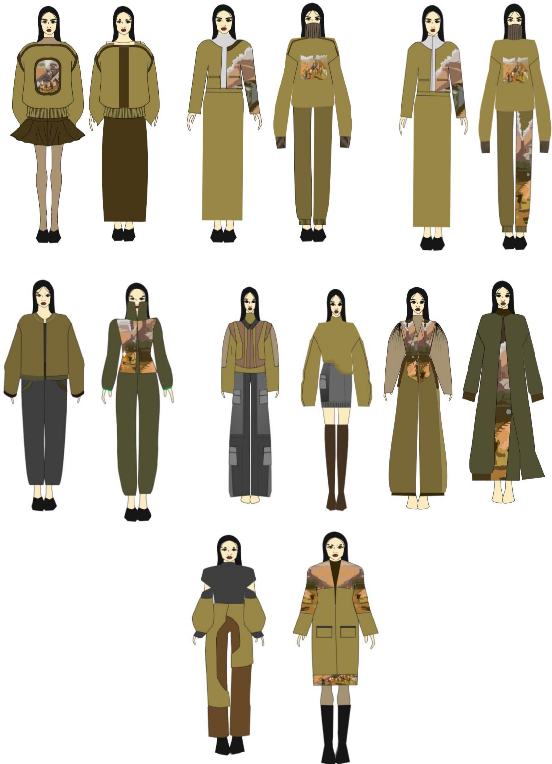
Сурет 4. Графикалық эскиздер: кәжуал стильдегі қыздарға арналған киім топтамасы.