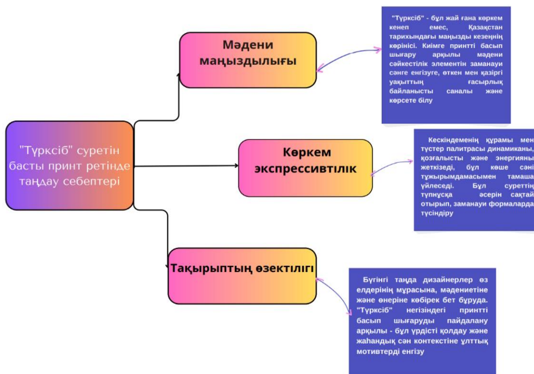
Сурет 1. Басты принтті таңдау себептері