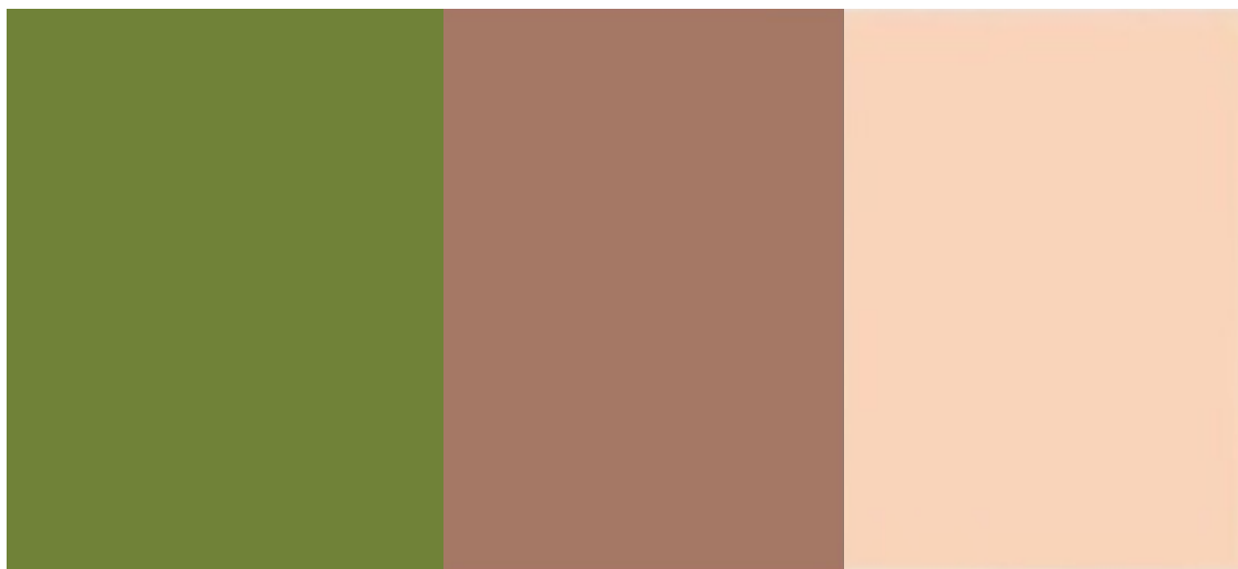
Сурет 3. Таңдап алынған түстер (Pantone, Vogue трендтері)

Түс – ақпарат пен эмоция тасымалдаушысы. Ол топтаманың көңіл күйін, стильдік бағытын және идеялық мазмұнын айқындайды. Осы тұрғыда түс дөңгелегі дизайнерлер үшін әмбебап құрал болып саналады. Сонымен қатар, Pantone институты ұсынатын түстік трендтер сән индустриясында маңызды бағдар қызметін атқарады (Сурет 3).