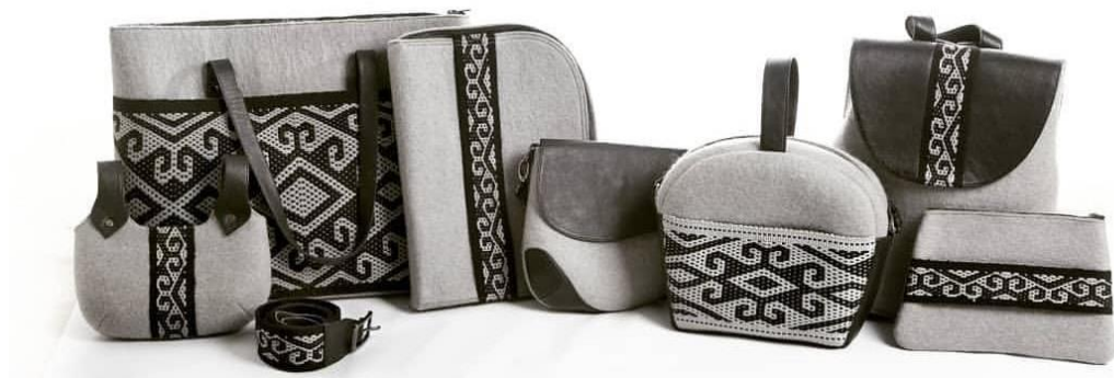
Рисунок 1. Коллекция сумок «Процветание»